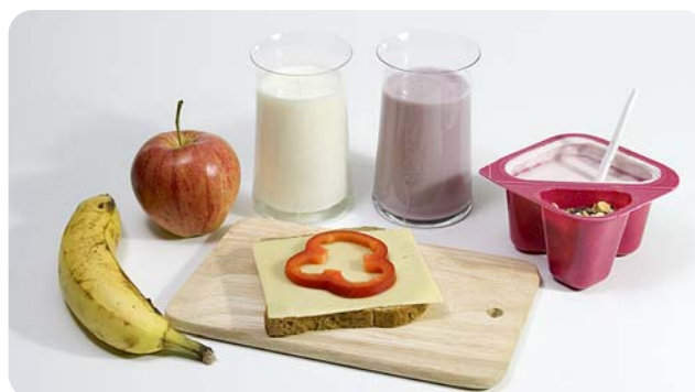
Modne bananer, melk og yoghurt er gode eksempler på hva som kan inntas etter treningsøkten.

Glykogenlagrene i muskulaturen reduseres i løpet av en treningsøkt. Det er avgjørende at utøveren har et tilstrekkelig inntak av karbohydrat rett etter økten for rask restitusjon.